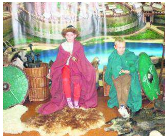
Dzieci mogły się poczuć jak rycerze sprzed lat