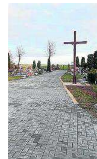
FOT. MONIKA LUKASZÓW