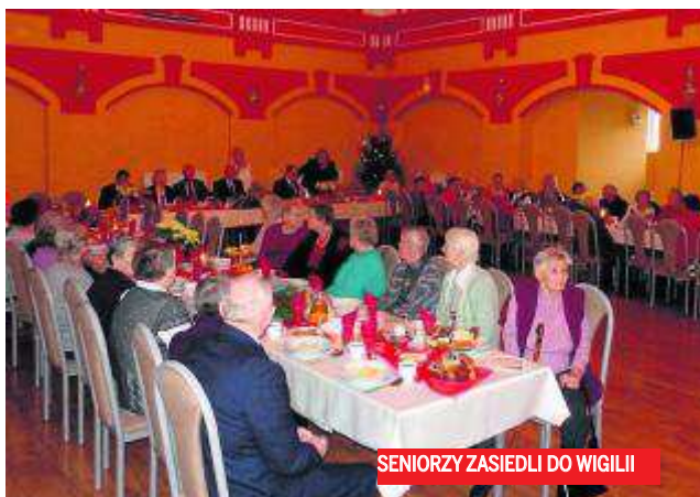
SENIORZY ZASIEDLI DO WIGILII

Oprócz licznie przybyłych mieszkańców w spotkaniu udział wzięli również wszyscy kierownicy gminnych jednostek organizacyjnych. Uroczystość z wielkim zaangażowaniem przygotowana została przez pracowników GOPS-u oraz GOKiS-u. Stoły wręcz uginały się od bożonarodzeniowych specjałów, a na zakończenie spotkania każdy z uczestników otrzymał miłą, świąteczną niespodziankę. ●