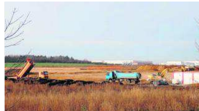
Prace przy budowie idą już pełną parą

O postępach przy realizacji inwestycji w Gniewomierzu będziemy jeszcze informować naszych czytelników. ●