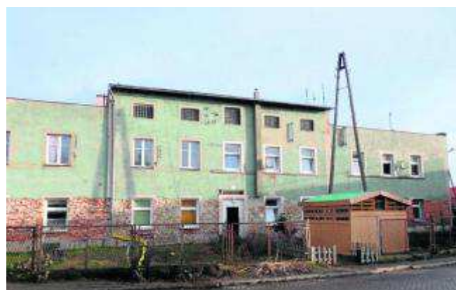
W tym budynku doszło do zadymienia